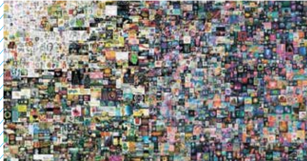
סרטון בן 10 שניות של האמן Beeple