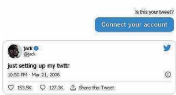
הציוץ הראשון של מייסד טוויטר ברשת