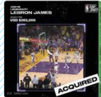
הטבעה של הכדורסלן לברון ג'יימס