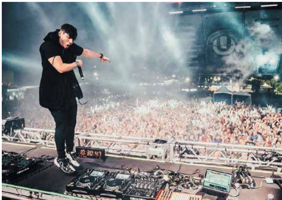
הדיג'יי 3LAU בהופעה. מכר את אלבומו במיליון דולר בפלטפורמת Origin Protocol

הבעיה השנייה היא המחיר הסביבתי הכבד. במחקר שפורסם בפלטפורמת הבלוגים "מדיום" על ידי ממו אקטן, אמן דיגיטלי בעצמו, טוען כי "טביעת הרגל הפחמימנית של יצירת NFT אחת שווה לצריכת החשמל של אורח אירופי במשך יותר לחודש, עם פליטת מזהמים ששווה לנהיגה של 1,000 ק"מ או שעי"תים של טיסה".