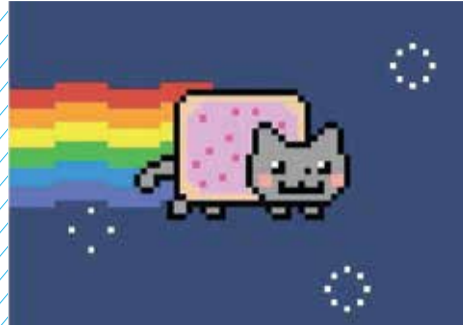
גיף של Nyan Cat