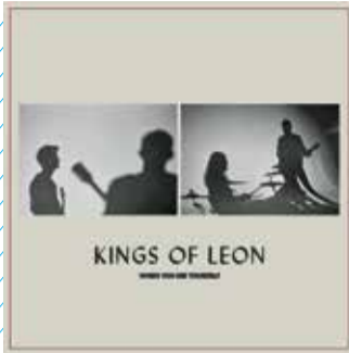
אלבום של להקת Kings of Leon